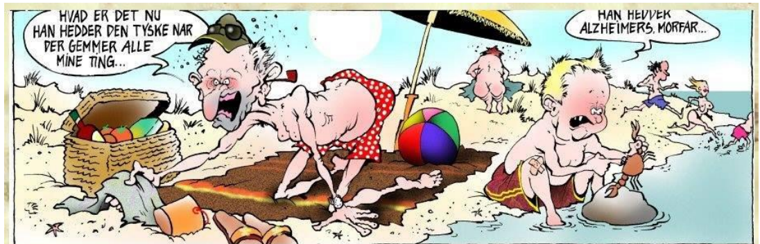
Ferie hos Morfar